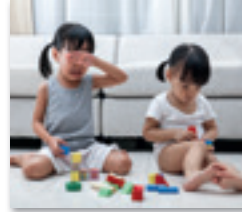
snel op de tenen getrapt zijn

snel op de tenen getrapt zijn – met de tijd meegaan – met je gat in de boter vallen – de appel valt niet ver van de boom