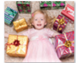
met je gat in de boter vallen