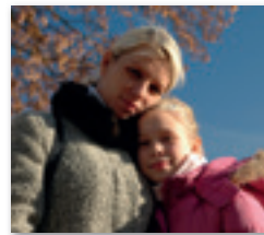
de appel valt niet ver van de boom