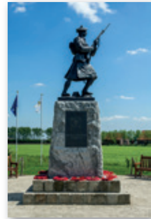
The Black Watch – Ieper, H. Duquesnoy

Elke avond houdt de soldaat de wacht met zijn geweer.