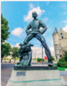
Lange Wapper – Antwerpen, A. Poels © SABAM Belgium 2019