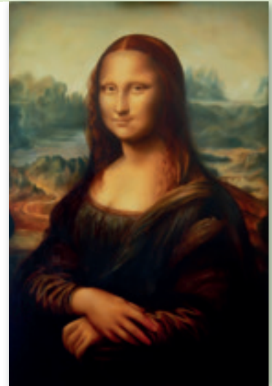
Mona Lisa – Leonardo da Vinci

De vrouw lacht op een stoel met een prachtig landschap achter zich.