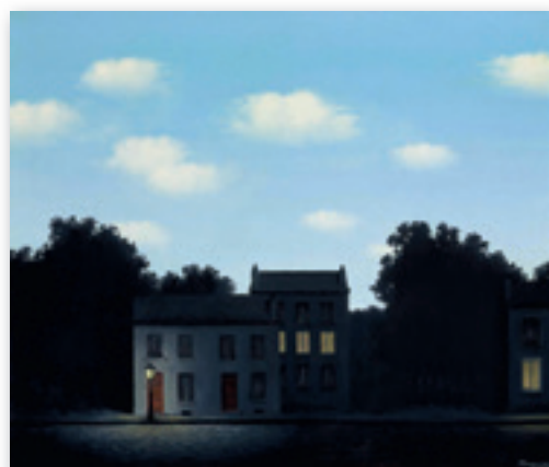
L'empire des lumières – René Magritte © Succession René Magritte – SABAM Belgium 2019

avontuur – rust – gezond – nat – wandel – Belg – griezel – water – pracht